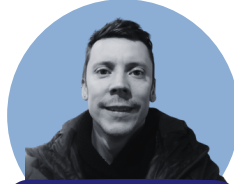
Tristan an Nedeleg

Besprezidantez - Kentañ derez Vice-présidente - Premier degré besprezidantezh@diwan.bzh